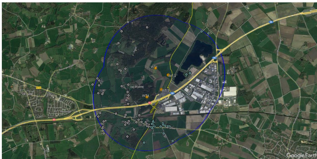
Afbeelding: Direct omwonenden van windpark De Lutte binnen een straal van 1500 meter

Ieder perceel dat binnen de wettelijke en technische restricties valt van het plangebied is onderdeel van de ontwikkeling van het windpark. In totaal zijn 6 landeigenaren bereid zijn/haar gronden ter beschikking te stellen aan Windpark De Lutte. Alle woningen binnen een straal van 1500 meter (zowel aan de Duitse als Nederlands kant van het projectgebied), gerekend vanaf de windturbines, worden in dit participatieplan meegenomen als direct omwonenden. In totaal zijn er 52 Nederlandse woningen en 37 Duitse woningen die in aanmerking komen voor een tegemoetkoming.